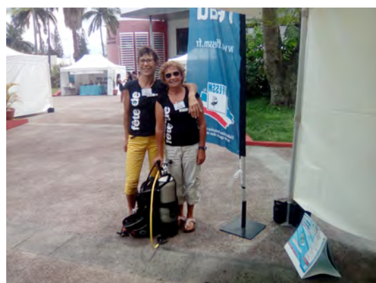
Le stand du comité au campus du Tampon