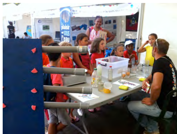
La plongée et les sciences s'adressent aux élèves

Ces deux journées ont été l'occasion de diffuser des messages de sécurité par rapport à l'environnement marin, d'exposer les résultats du suivi scientifique de l'Antonio Lorenzo, et d'informer les visiteurs les possibilités de pratiquer toutes formes de plongée à La Réunion.