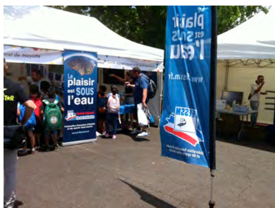
Le stand du comité au campus du Moufia