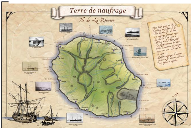
Un poster relatant les plus grands naufrages de l'île bientôt disponible.